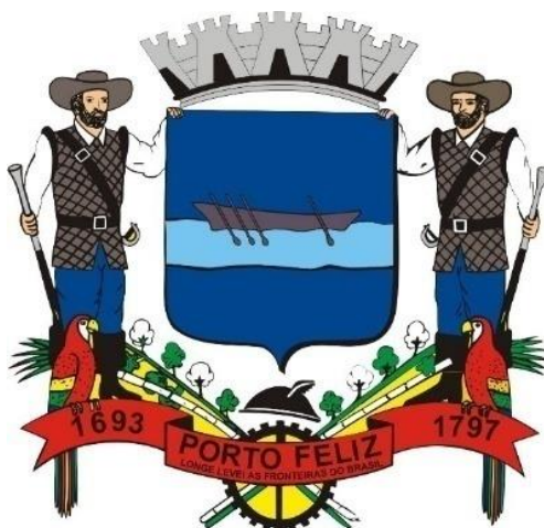
Bandeira da cidade